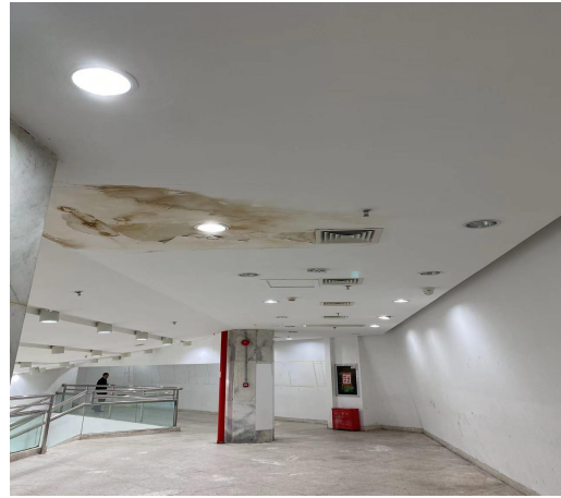
图二、三楼科普展厅进入报告厅过道签到音响室过道墙面及天花